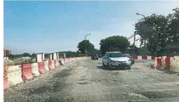
棕油提炼厂前的路况恶劣，导致居民频频投诉。