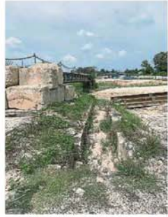
桥旁的排水沟已铺设完毕。