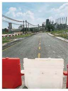
新的马路已建好，只待桥身建成即可进行接驳。