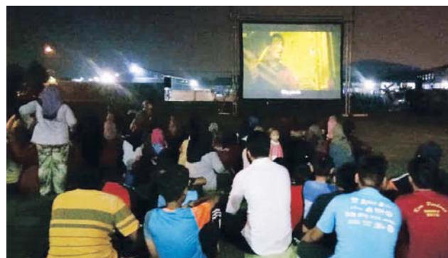
Orang ramai tidak melepaskan peluang menonton wayang pacak Paskal The Movie di padang Taman Suria Pendar, semalam.

"Selain bersantai bersama keluarga, penonton juga diberi pesanan dan nasihat mengenai penjaga-