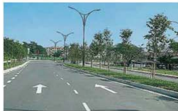
根登新镇和新兴屋业发展区的马路已建成，预计可纾解过去因为马路狭小所造成的交通阻塞问题。