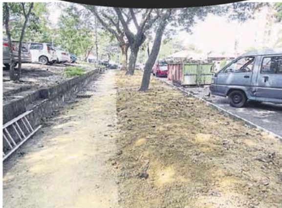
■双溪龙SL1路路边的人行道正在重建。