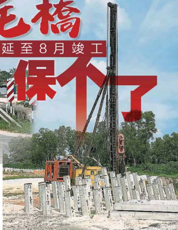
随着双车道根登新桥的桥柱和地基已打好，工程估计可在8月落成。

他说，鉴于新桥在落成后是衔接煤炭山路、菁多岭、万捷市镇、根登工业和商业区，以及发璋新村的主要通道，因此同步扩建马路以承担庞大的汽车流量是有必要的。 “但工程局在进行初步研究后，发现如果要扩建通往新村的马路，解决村内的交通瓶颈问题和加速纾通往返LATAR的汽车流量，则恐怕会需要征用部分村地和拆除一些房屋，所以大家均同意目前应维持现状，日后再行打算。”