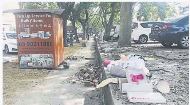
走道沦为民众丢垃圾的地点。