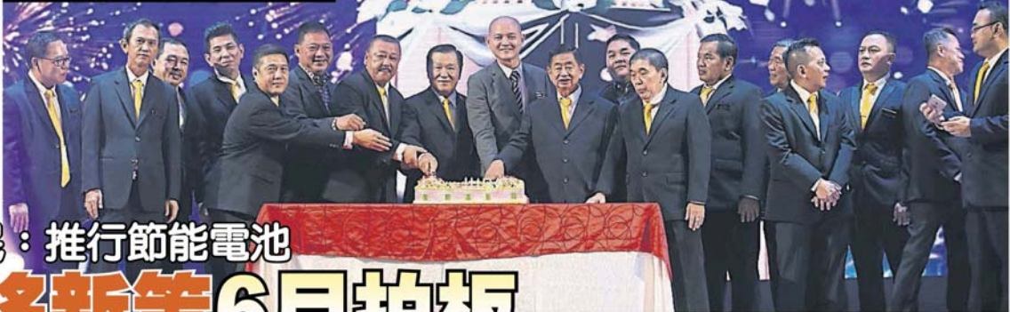
雪蘭莪暨聯邦直轄區摩托車商公會理事們，一同進行切蛋糕儀式。