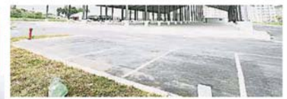
據觀察，巴剎範圍內的停車位已經建好。