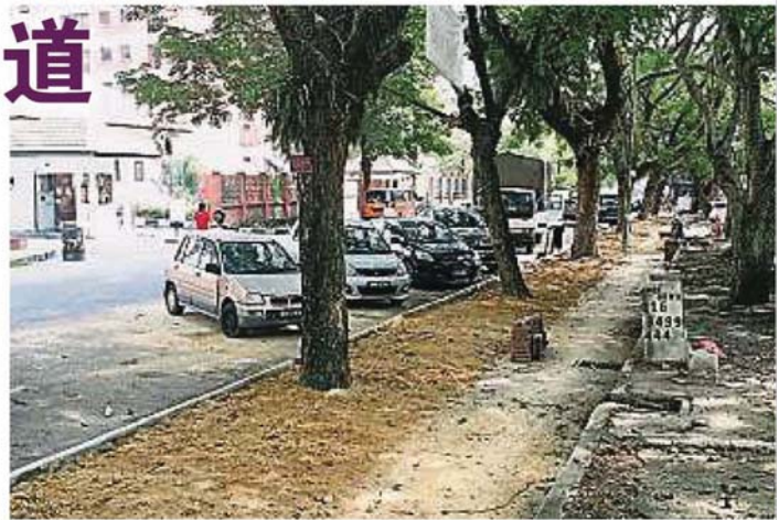
市议会将对行人道上的十多棵30年树龄雨树进行保育工作。

他表示，除了洋灰行人道会保留之外，也会增建瓷砖梯级，方便民众上下，而雨树旁的泥土会种草，