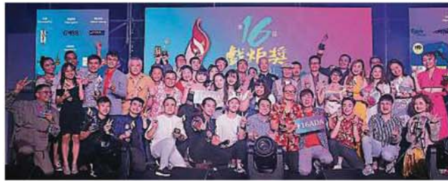
所有得奖者与颁奖人合照。