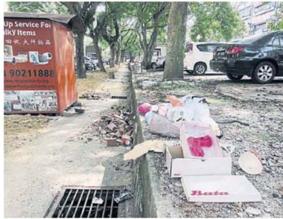
■人行道旁总是有人丢垃圾。