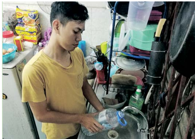
Ahmad berharap pihak bertanggungjawab menyelaraskan bantuan pengagihan bekalan air di kawasan yang terjejas.

Penduduk harap tempoh masa gangguan dapat disingkatkan