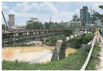
红毛桥的排水管和各種能管管的移除工程浩大，所幸已几乎完工。