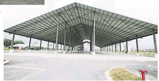
巴剎硬體設施和基本結構如鋅片屋頂、洋灰建造的檔口、停車位、廁所、垃圾房與保安亭都已建好，但軟體設施仍不足。

他也建議和鼓勵小販在羅里上擺檔，並可以从清晨5、6時營業至上午11時，由清潔工人清理後，再由其他單位接力，如舉辦各種市集，以充分利用該巴剎。