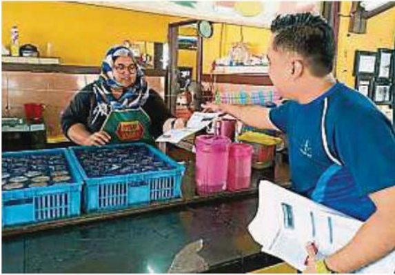
雪州水务管理公司人员到灵市14区派发制水通知。