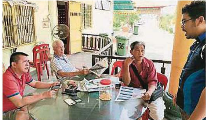
雪州水务管理公司人员提醒甲洞地区的民众，为来临24日的制水做好储水准备。