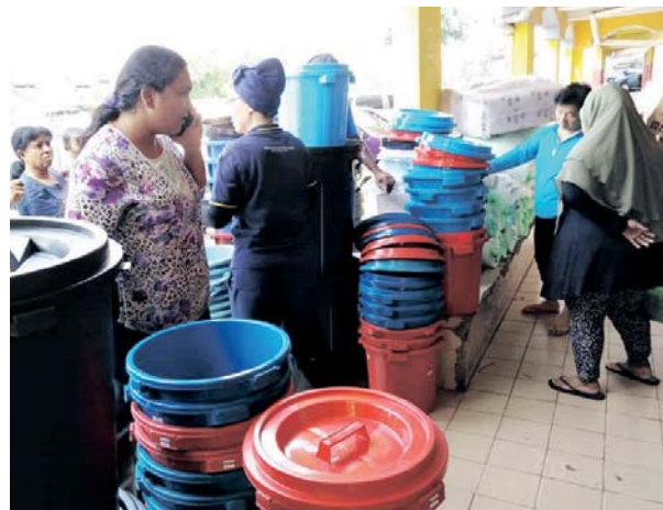
Orang ramai memilih tong air pelbagai saiz sebagai persiapan menghadapi gangguan bekalan air esok.

"Kalau ikutkan memang tidak cukup bagi kegunaan sepanjang gangguan dalam tempoh hampir tiga hari. Mujur ada jadual pembekalan air secara berjadual yang dapat membantu kami menyimpan air," katanya.