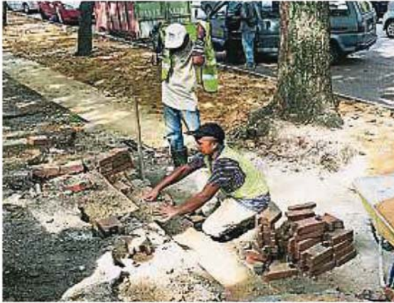
行人道将增建瓷砖梯级，方便民众上下。